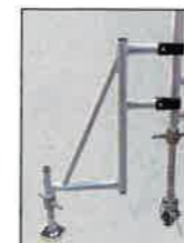
アウトリガー取り付け例