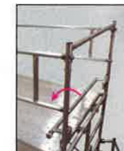
手すりわくの中棧が倒れるので スムーズに作業床に乗り込めます