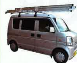
3CSM-77 (軽自動車に積載可能) ※3CSM-87は普通車積載可