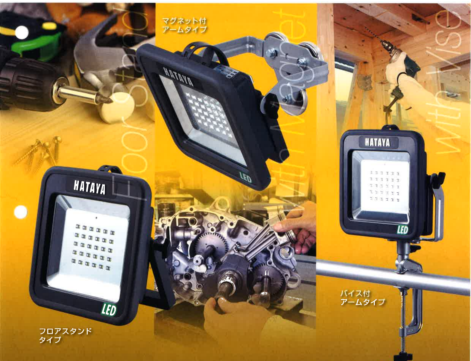
マグネット付 アームタイプ